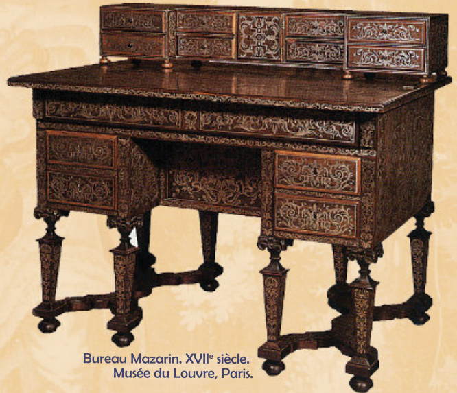
Bureau Mazarin. XVII e siècle. Musée du Louvre, Paris.

Le « style Louis XIII » (1 ère ½ du XVII e siècle) se caractérise par une lutte entre les diverses expressions régionales de l'art de la Renaissance et les produits influencés par les artistes italiens et hispano-flamands. Les meubles sont très luxueux, plaqués, incrustés d'ébène, d'écaïlle, d'ivoire, de mosaïques et de pierres précieuses. On utilise abondamment le bronze, la polychromie, donnant au mobilier une allure chargée et lourde. Le meuble alors indispensable à tout intérieur est l'armoire. Le bureau est une innovation.