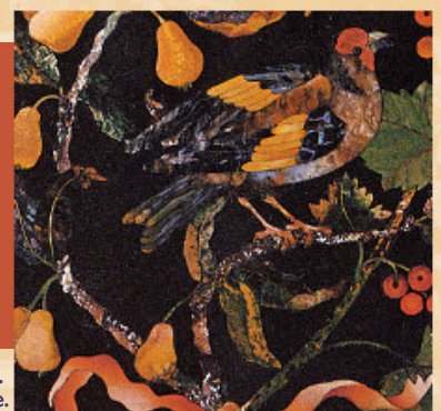
Détail de marqueterie de pierres dures d'un cabinet en ébène. D. Cucci. 1678. Coll. privée.

L'évolution du mobilier au XVII e siècle témoigne d'une recherche de l'élégance et du confort. Les meubles font partie intégrante de la décoration des demeures. On s'attache à faire de ces dernières des œuvres d'art où lambris, peintures, tapisseries, mobilier, s'unissent étroitement.