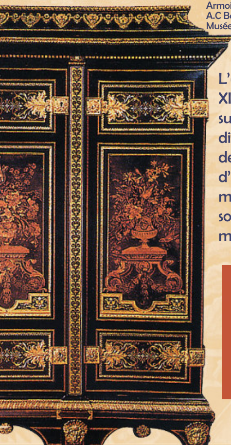
Armoire à 2 battants. A.C Boulle. Vers 1700. Musée du Louvre, Paris.

L'unité qui se dégage de la période qui suit est due à la personnalité de Louis XIV et à la domination de Charles Le Brun, grand animateur des arts et surveillant général de la production. Dans la technique de fabrication, rien ne diffère véritablement, mais l'emploi du bronze est plus important. Apparaissent des meubles alliant différentes techniques de marqueterie : bois de couleur, d'écaïlle, d'ébène, d'étain ou de cuivre. Après 1680, les lignes générales du meuble deviennent plus souples. Les meubles caractéristiques de cette période sont l'armoire, la commode, les tables de milieu et les consoles. Une quantité de meubles nouveaux sont créés tels que bibliothèques, horloges et médailliers.