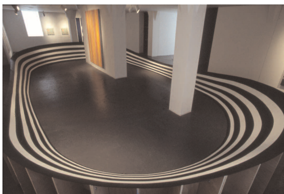
John Tremblay, Curved'Air 98 , 1998 Contreplaqué et peinture, 12 x 6 m Collection FRAC Poitou-Charentes, photo : Elac, Lausanne.