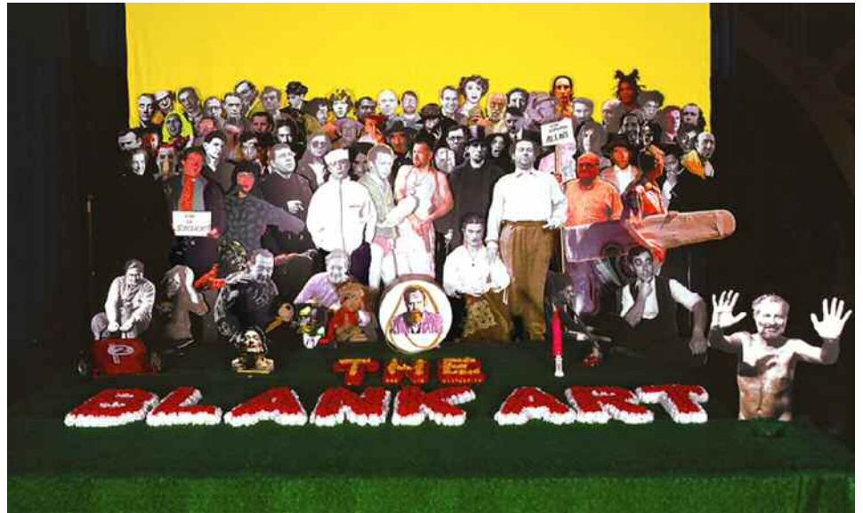
A droite : Olivier Blanckart, Postpop 1 : XXe Century Art Camp , 2000 Coll. FRAC Poitou-Charentes