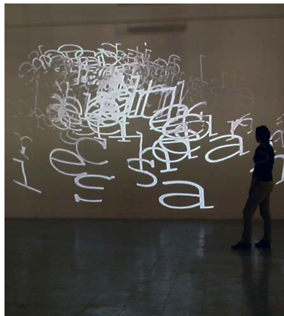
Moby-Dick, projection vidéo, 2005