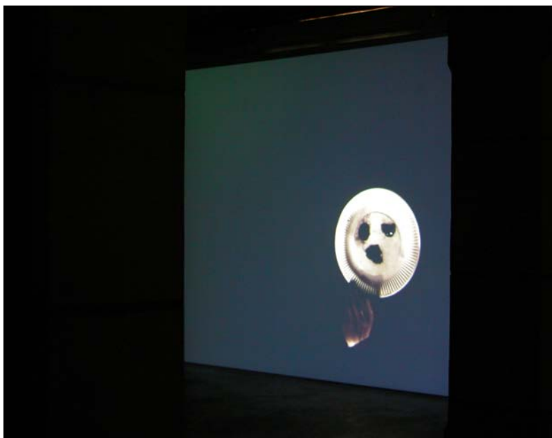
Jeu de montre, vidéo, 2010